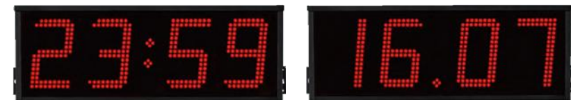
LUMEX 15–45 with time / date interval display