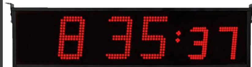
LUMEX 15–45 S