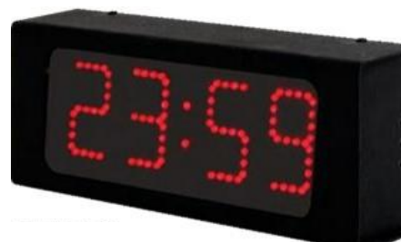
LUMEX 5, 7, 12