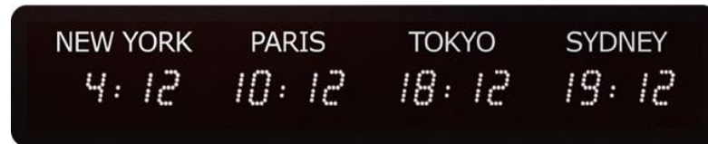
Style World time clock