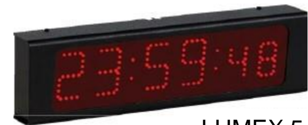
LUMEX 5, 7, 12 S