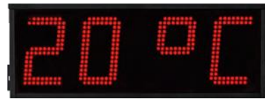
Optionally with temperature display